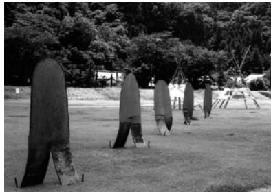
「国際丹南アートフェスティバル2004《武生》素材と表現」 (H16年度助成 丹南アートフェスティバル実行委員会)