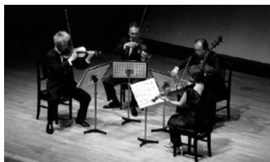
「30周年記念演奏会」 (H16年度助成 ニューアーツ弦楽四重奏団)