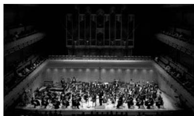
「第6回現代日本オーケストラ 名曲の夕べ」 (H17年度助成 (社)日本オーケストラ連盟)