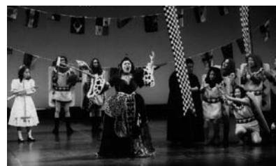
「オペラ 不思議の国のアリス」 (H17年度助成 モーツァルト劇場)