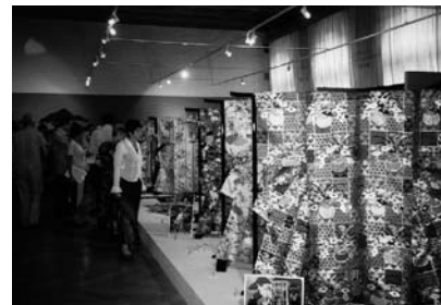
「能装束・能面展」(H15年度助成 浅井能楽資料館)